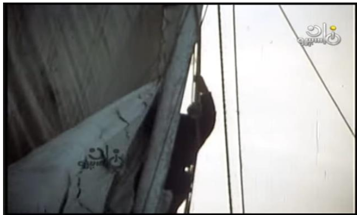
صورة رقم (٤) للصياد وهو يجهز المركب للخروج للصيد