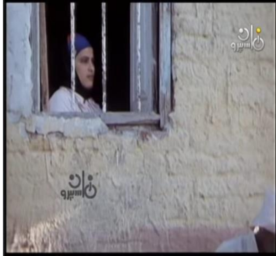
صورة رقم (٩) الأم وهي تنظر لأبنائها وهم ذاهبون إلى المدرسة