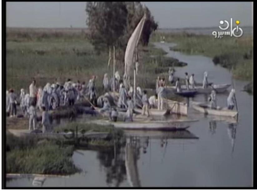
صورة رقم (١٣) للتلاميذ امام المدرسة