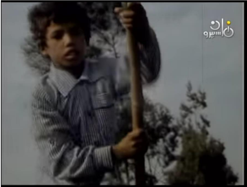
صورة رقم (١٢) على وهو يجذف مسرعا للحاق بالمدرسة