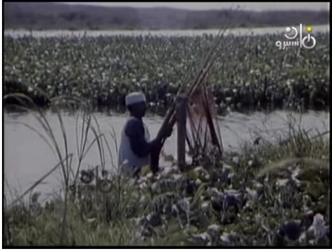
صورة رقم (١١) للاب الصياد وهو يضع نوع من الشباك في الماء