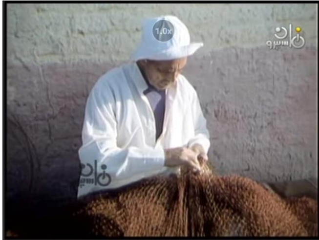
صورة رقم (٧) للجد وهو يصنع شبكة صيد

جدول رقم (٦) يوضح تحليل الصوت بمشهد رقم ٧