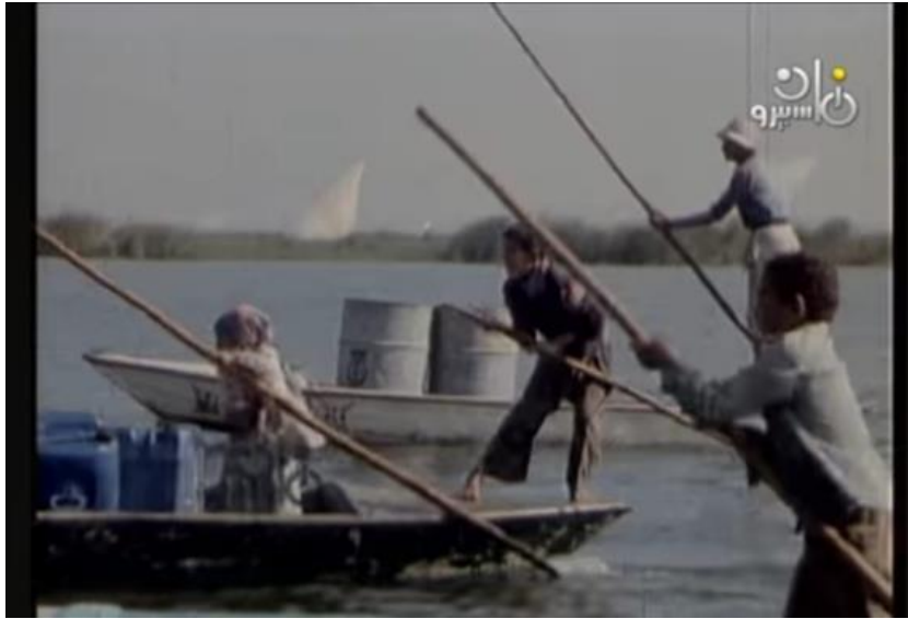
صورة رقم (١٨) لمجموعة من الصيادين وهما عائدون من رحلة الصيد

جدول رقم (١٦) يوضح تحليل الصوت بمشهد رقم ١٦