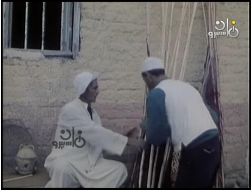
صورة رقم (١٠) للاب وهو يأخذ من والده شباك الصيد

جدول رقم (٨) يوضح تحليل الصوت بمشهد رقم ١٢