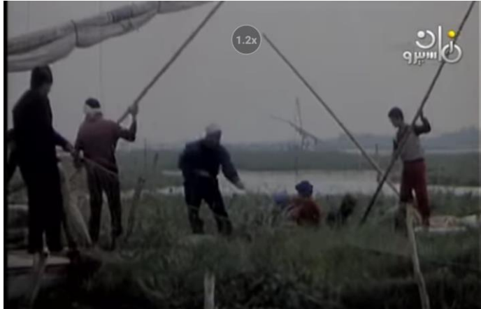
صورة رقم (١٥) لمجموعة من الصيادين وهم في رحلة الصيد