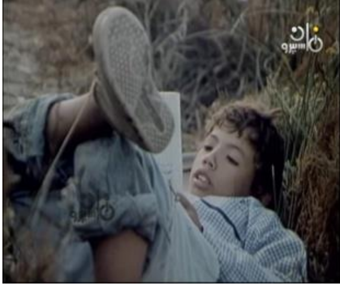
صورة رقم (٢٧) توضح على وهو يدرس بعد المدرسة