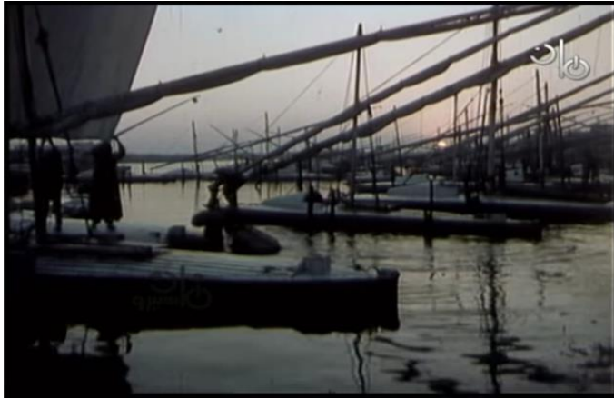
صورة رقم (٥) لمجموعة الصيادين وهم يتجهزون للخروج للصيد