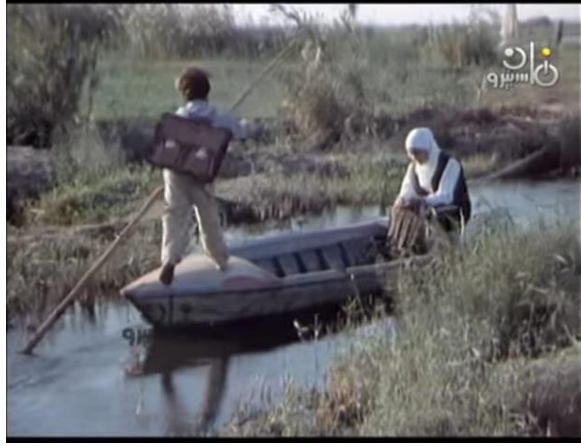
صورة رقم (٨) علي واخته وهم ذاهبون إلى المدرسة