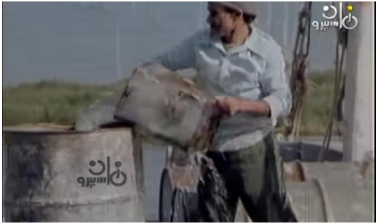
صورة رقم (٢٠) لصياد وهو يملئ الجالونات