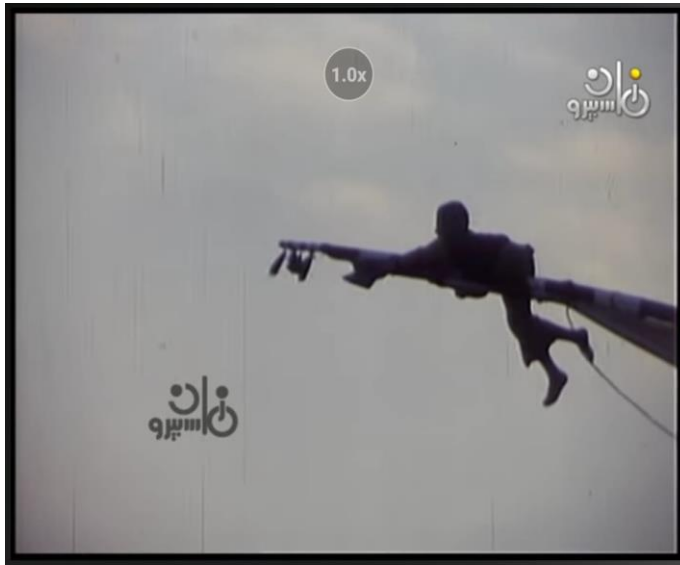
صورة رقم (٦) لصياد صغير وهو يرفع الشراع