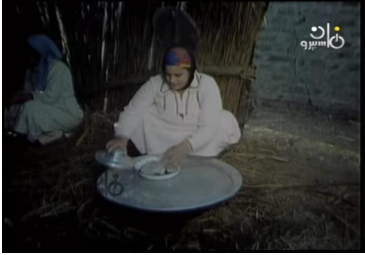
صورة رقم (١٩) تظهر الام وهي تجهز الغذاء