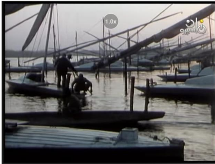
صورة رقم (٣) لصيادين يجهزون المركب قبل الخروج للصيد

جدول رقم (٤) يوضح تحليل الصوت بمشهد رقم ٤