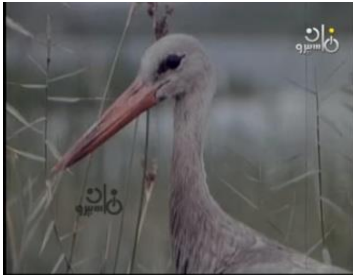
صورة رقم (٢٦) نطائر يظهر امام علي وهو يدرس