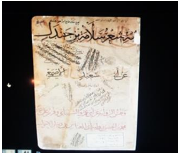
صورة رقم (٧): صورة توضح مدى الامتاع والجذب للتكنولوجيا التفاعلية لعرض المخطوطات