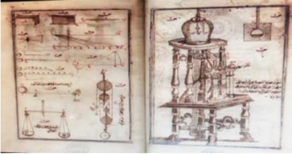
صورة رقم (٢): صورة ل احد المخطوطات المتاحة بتقنية شاشات اللمس