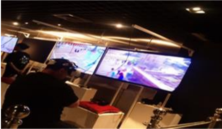
صورة رقم (١): صورة توضح تقنية استخدام تقنية VR في عرض التراث المصري والايطالى

نجد أن الاهتمام والوعي المتزايد من قبل الافراد والهيئات الرسمية لحفظ وتوثيق التراث الشعبي بشقيه المادي والغير مادي جعل الهيئات الرسمية تعمل على توظيف التكنولوجيا في التعريف بالتراث والاستثمار فيه على نحو مستمر، وبالفعل قامت مكتبه الاسكندرية بالتعاون مع السفارة الايطالية بعرض التراث المعماري لإيطاليا، وخلق المعاشة والتفاعل وليس مجرد المشاهدة فحسب، وذلك باستخدام تقنية VR (صورة ١)