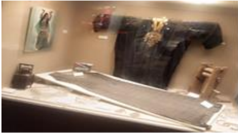
صورة رقم (١٢): (صعيد مصر) الثوب التقليدي، وثوب مصنوع من التل