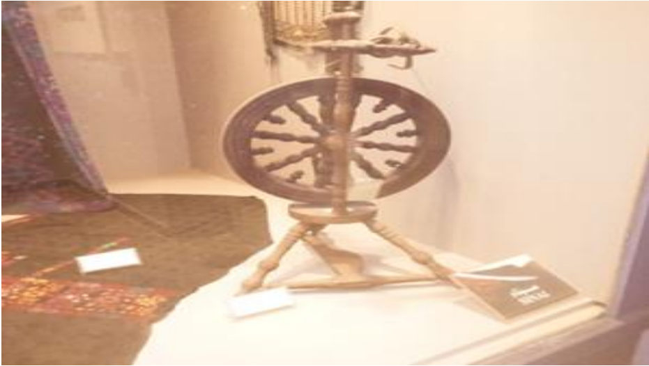
صورة رقم (١٠): (سيناء): المغزل، هو أداة كانت تُستخدم لتحويل صوف الماعز والخراف إلى غزل لاستخدامه في احتجاجات البيئة السيناوية.

الباحثة والإخباري على وجود تلك المقتنيات بداية من الإدارة المتحفية الالكترونية والتي تدعم وتساعد الإدارة البشرية وهذا يرجع لوجود المعرض ضمن المعارض الرقمية على موقع مكتبة الاسكندرية ،كما أن وجود نسخة الكترونية للمعرض سمحت لزائري الموقع بالتجول برجائه دون الحاجة الى الذهاب أو السفر للمكتبة وكذلك تحميل الصور الخاصة للمقتنيات ومعرفة كافة المعلومات الخاصة بها والتواصل بين الإدارة الالكترونية للمتحف وبين الزائرين الافتراضيين للمعرض الافتراضي على شبكة الانترنت، وقد ساعدت التقنيات الرقمية الباحثة في توثيق الزيارة الميدانية عن طريق استخدام الكاميرا وتصوير المقتنيات وشرح طرق العرض، تنقسم المقتنيات المتحفية إلى عدة اقسام وفقا للبيئات المصرية بداية من سيناء مرورا بالدلتا ثم سيوه وختما بالصعيد ، ثم تعرض مجموعة متنوعة من المقتنيات التراثية لمجموعه من الدول أمثال العراق واليمن والمغرب وتركيا، وفي نهاية الجولة توجد مجموعته الحلى والتراث والخاصة بالفنانه بالدكتورة يسريه عبد العزيز .