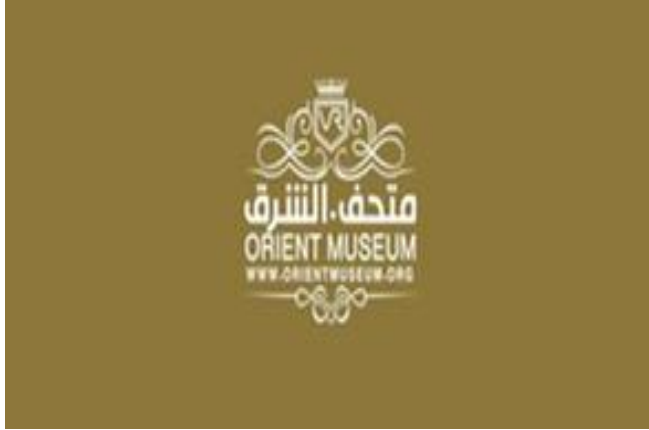
صورة رقم (٣): اللوجو الخاص بمتحف الشرق على مواقع الانترنت

تُتيح الرقمنة قراءة أفضل للتراث الشعبي من تلك التي يُتَحها التعامل مع النص الأصلي، مع زيادة قيمة النصوص والعناصر التاريخية، حيث يمكن أن تمثل الرقمنة فرصة الاستفادة القصوى من مصادر المعلومات القيمة والنادرة، والتي يمكن ان تكون في بعض الاحوال على نطاق واسع(سوقال، ٢٠٢٠، ص١٠٢:٨٥). ونجد للعديد من الدول العربية سبق في الحفاظ على الذاكرة التراثية العربية وتشجيع استراتيجيات التوثيق الالكتروني للموروث التاريخي على سبيل المثال تجربة كل من الامارات العربية المتحدة- السودان- العراق - عُمان(محمد، ٢٠١١، ص٤٧).