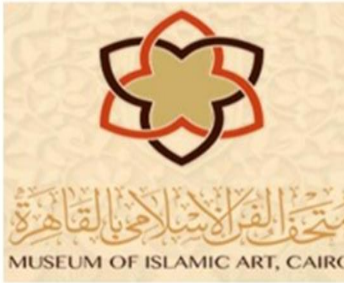
صورة رقم (١٣): اللوجو الخاص بمتحف الفن الاسلامى بالقاهرة

قام متحف الفن الاسلامي بالمبادرة الاولى من بين المتاحف المصرية بإطلاقه هوية بصرية مميزة للفن الاسلامي، وقام بعمل جزء تفاعلي بين الزائرين endlessArt والجمهور المتلقي من خلال اطلاق (هاشتاج #) حيث تم تفعيله من خلال موقع التواصل الاجتماعي حيث يتفاعل الاشخاص ويقوموا بتصميم أشكال تميز الفن الاسلامي، وبعدها تقوم مسابقة لاختيار التصاميم التي أثارت اعجاب الجمهور من خلال العدد الأكبر من المشاركات والاعجابات (صوره ١٣).