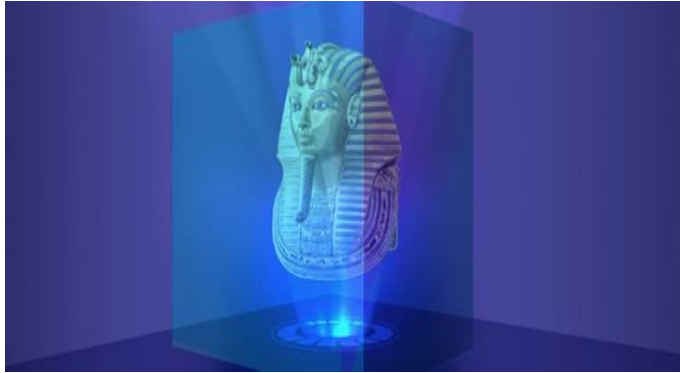
صورة رقم (٨): صورة بتقنية الهولوجرام للقناع توت عنخ آمون تحاكي القناع الاصلى بالمتحف المصرى

الهولوجرام هو عرض مرئي يقوم بإعادة إنشاء الصورة وعرضها بشكل ثلاثي الأبعاد عالي الجودة، لتطفو الصورة في الهواء كمجسم هلامي و يظهر كطيف من الألوان يتجسد على الشكل المراد عرضه، تقوم فكرة عمله على حدوث تصادم بين الموجات الضوئية والشئ الذى يرغب المستخدم فى تصويره وعرضه، فبالنسبة لأجهزة الهولوجرام المتخصصة، يقوم الجهاز بتخطيط الجسم المراد تصويره ثم نقل المعلومات اللازمة حوله، ويتيح هذا الجهاز إمكانية تكرار إنشاء الموجة مرة أخرى فى حالة إضاءة جهاز الهولوجرام، كذلك فقد بدأت بعض التطبيقات العادية على الهواتف الذكية بتوفير تقنية الهولوجرام للمستخدمين العاديين من خلال بعض التطبيقات والأدوات البسيطة بشكل كبير(www.cairo24.com)، فقد طور مركز توثيق التراث التابع لمكتبة الإسكندرية صورة ثلاثية الأبعاد لقناع الملك توت عنخ آمون (هولوجرام) (صوره٨)، وتم وضعها مكان القناع الأصلي بقاعة المتحف المصري بعد نقله إلى معمل الترميم . الهولوجرام هو أحدث تقنيات العرض المتحفى وهو البديل الامتع عن الطرق التقليدية، من خلال تطبيق الاستخدام الحديث لتقنية Pepper's Ghost أنتج المركز عروض ثلاثية الأبعاد في مجال التراث.