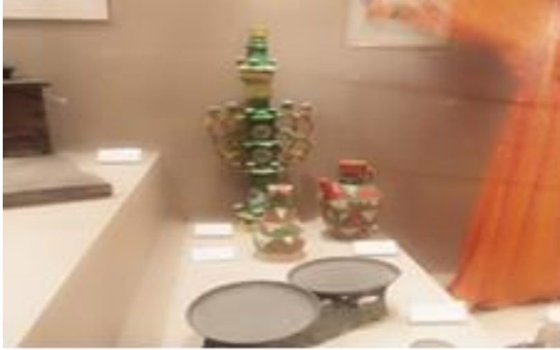
صورة رقم (١١): (الدلتا) قله السبع، تُوضع في حاله المولودة الانثى لاعتقادهم انها وعاء المستقبل وانااء الرجل لتكون رمز الخصوبة وتنجب البنات والبنين في المستقبل