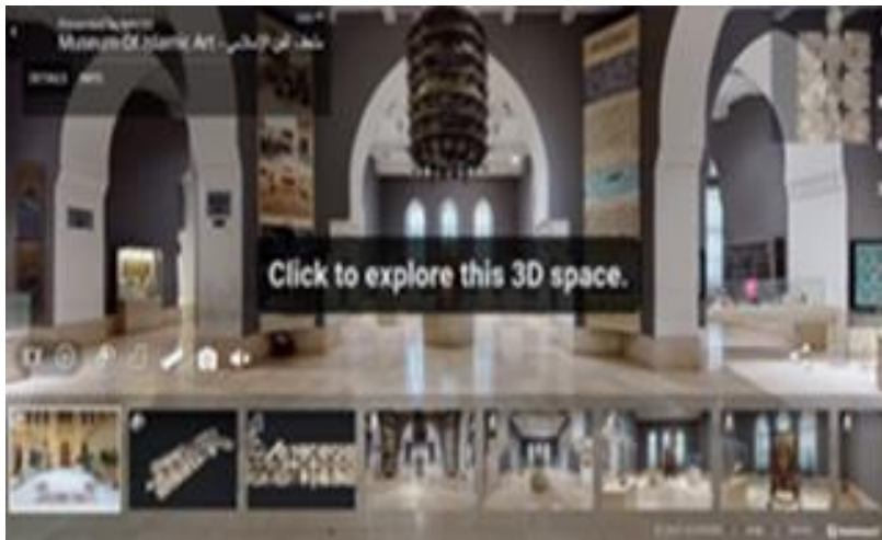
صورة رقم (٥): صورة من داخل الجولة الافتراضية للمتحف الفن الاسلامي