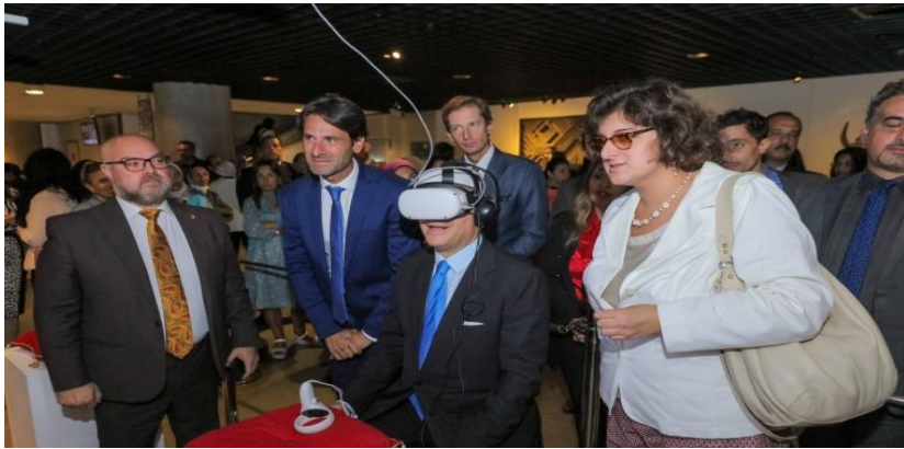
صورة رقم (٩): تجربة السفير الايطالي للمتحف الافتراضى الذي أقيم في مكتبه الاسكندرية لدعم المنظور الرقمي للتراث الثقافي الايطالي والمصري.

وقد نظمت مكتبة الإسكندرية من خلال متحف الآثار معرض "منظور رقمي على التراث الثقافي المصري والإيطالي: جولة افتراضية ثقافية مشتركة"، يوم الأربعاء الموافق ١١ أكتوبر ٢٠٢٣ (صورة ٩).