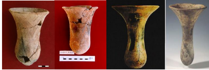
شكل (٣): بعض نماذج من كنوس التوليب: على اليمين: من دفنات جبل الرمل، الوسط: من جبانة R12 بالنوبة العليا، وعلى اليسار: من جبانة الكدادة بوسط السودان.